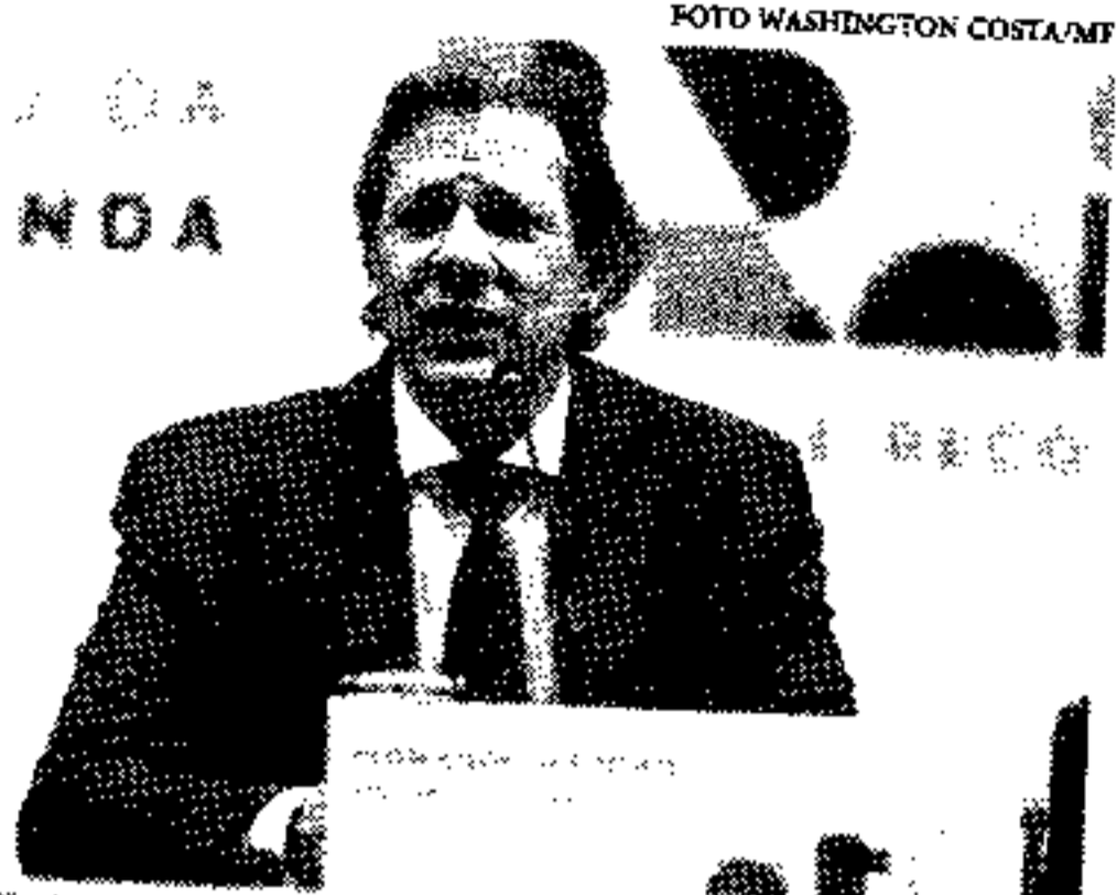
Pacote fará parte de uma medida provisória que deve ser editada pelo governo ainda em 2023

Com a meta de zerar o déficit primário em 2024, o ministro da Fazenda, Fernando Haddad (PT), anunciou nessa quinta-feira (28) três novas medidas econômicas para evitar perda de arrecadação e reforçar o caixa da União no próximo ano. O pacote fará parte de uma medida provisória (MP), que entrará em vigor após a publicação, que deve acontecer ainda em 2023.