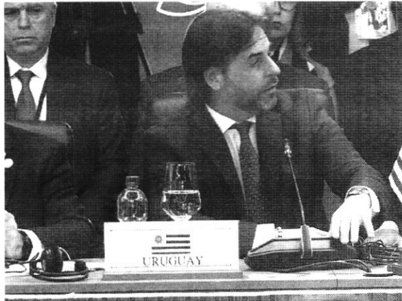
De acordo com o uruguaio, não só a “mensagem” é importante, como também o “mensageiro”

A falta do presidente argentino, Javier Milei, na cúpula do Mercosul, continuou reverberando entre as autoridades sul-americanas nesta segunda-feira, 08, durante a reunião do bloco em Assunção, no Paraguai. O presidente uruguaio, Luis Lacalle Pou, por exemplo, afirmou que a “mensagem” não é a única coisa importante, mas também o “mensageiro”. Se o Mercosul é tão importante, todos os presidentes deveriam estar aqui. Eu dou importância ao Mercosul. E se realmente acreditamos neste bloco, todos deveríamos estar aqui”, argumentou em referência à escolha de Milei de não comparecer, e enviar sua ministra de Relações Exteriores, Diana Mondino, para representá-lo.