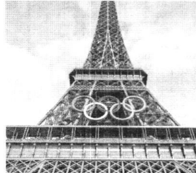
Os atletas devem começar a chegar a partir do dia 18 de julho