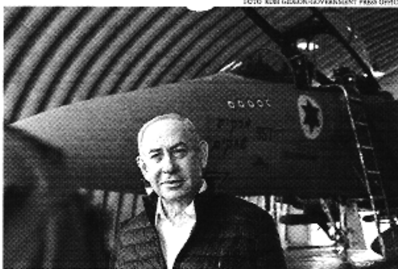
O comunicado foi divulgado pelo gabinete do premiê após uma visita a uma base da força aérea.

O primeiro-ministro de Israel, Benjamin Netanyahu, afirmou nesta quinta-feira, 11, que seu país está se preparando para um eventual cenário de problemas com a segurança para além da Faixa de Gaza, onde já está sendo travada uma violenta batalha contra o grupo radical islâmico Hamas. O aviso ocorreu em meio às especulações de que o Irã poderia orquestrar um ataque como forma de retaliar a suposta operação israelense que teve como alvo a embaixada iraniana em Damasco, na Síria. "Estamos nos preparando para atender às necessidades de segurança do Estado de Israel, tanto na defesa quanto no ataque", garantiu Netanyahu em um comunicado que foi divulgado por seu gabinete depois que o premiê visitou uma base da força aérea no sul do território. Conforme as informações divulgadas pela mídia internacional, o ataque em Damasco resultou na morte de sete integrantes da Guarda Revolucionária do Irã, inclusive, o comandante sênior Mohammad Reza Zahedi. Na interpretação do governo iraniano, a situação que ocorreu no dia 1º de abril, se assemelha a um ataque ao próprio Irã e, na última quarta-feira, 10, o atalafá Ali Khamenei, líder supremo do país, prometeu que haveria uma vingança. "Quando o regime sionista ataca um consulado iraniano na Síria, é como se tivesse atacado o solo iraniano. O regime maligno cometeu um erro e deve ser punido. E será", disse. Israel nunca reivindicou a autoria do bombardeio. A fala fez com que o ministro de Relações Exteriores