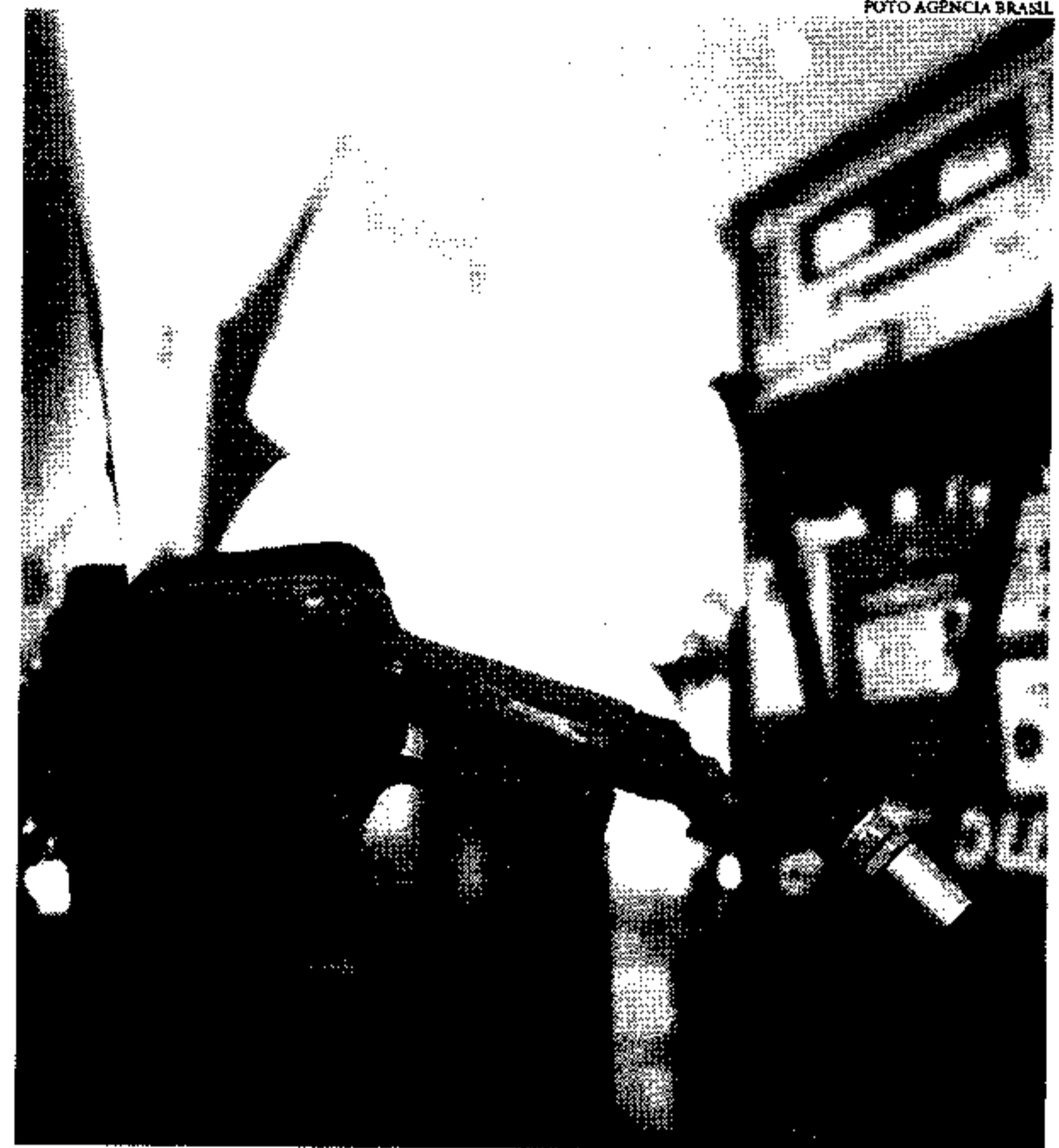
As vendas recorde de diesel totalizando 65,5 bilhões de litros

ços abaixo da média. Essa estratégia resultou em um aumento nas vendas em dezembro, indicando uma retomada gradual do consumidor em direção ao etanol. No entanto, a perspectiva de uma safra recorde este ano apresenta novos desafios ao setor. Os produtores agora aguardam uma mudança na percepção do consumidor diante dos preços favoráveis e das vantagens ambientais associadas ao etanol, que emite menos gases poluentes do que a gasolina. Apesar disso, a inércia do consumidor, que se habituou à gasolina mais barata, continua sendo um obstáculo a ser superado. O setor busca reforçar a cons-