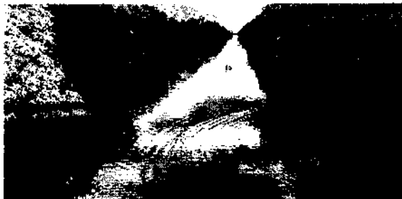
Parque do Cocó hoje é protegido por leis contra construções e desmatamentos