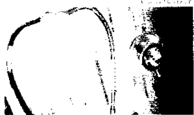
A Golden suspenderá temporariamente a comercialização de seus planos de saúde

De acordo com o documento, esse modelo está previsto na regulamentação dos planos de saúde e não altera o vínculo do beneficiário com a Golden Cross. O acordo foi fundamentado na resolução normativa N. 107 da Agência Nacional de Saúde Suplementar (ANS).