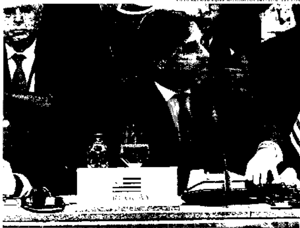
De acordo com o uruguaio, não só a “mensagem” é importante, como também o “mensageiro”

A falta do presidente argentino, Javier Milei, na cúpula do Mercosul, continuou reverberando entre as autoridades sul-americanas nesta segunda-feira, 08, durante a reunião do bloco em Assunção, no Paraguai. O presidente do Uruguai, Luis Lacalle Pou, por exemplo, afirmou que a “mensagem” não é a única coisa importante, mas também o “mensageiro”. “Se o Mercosul é tão importante, todos os presidentes deveriam estar aqui. Eu dou importância ao Mercosul. E se realmente acreditamos neste bloco, todos deveríamos estar aqui”, argumentou em referência à escolha de Milei de não comparecer, e enviar sua ministra de Relações Exteriores, Diana Mondino, para representá-lo.