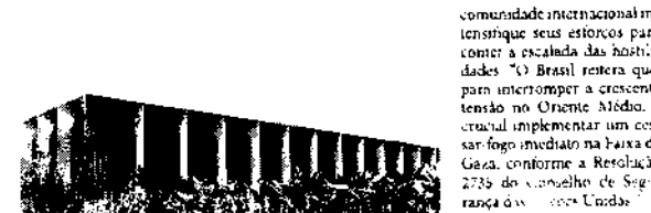
Comunicado foi emitido pelo Ministério das Relações Exteriores