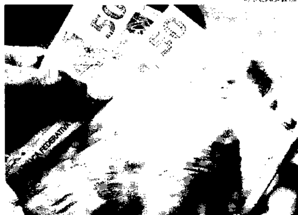
As estimativas de inflação para 2024 foram revisadas de 4% para 4,2%