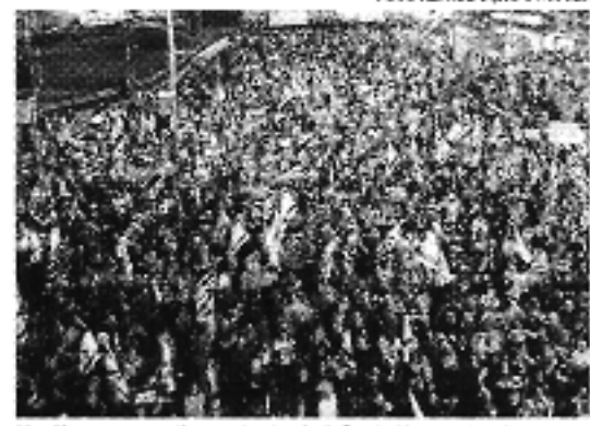
Manifestantes pediam pela destituição de Netanyahu do cargo de primeiro-ministro

Depois de uma noite de protestos massivos em Israel, o primeiro-ministro Benjamin Netanyahu se pronunciou neste domingo, 31, para defender a continuidade da guerra contra o grupo radical islâmico Hamas. "Como primeiro-ministro de Israel, estou fazendo tudo e farei tudo para trazer nossos entes queridos para casa. [...] Seus entes queridos são nossos entes queridos", defendeu o premiê, acrescentando que nada impedirá a operação em Rafah, onde estão refugiados mais de 1 milhão de palestinos. Dezenas de milhares de pessoas estiveram reunidas em Tel Aviv no sábado, 30, e Netanyahu considerou que aqueles que duvidam dos esforços do governo para liberar os reféns estão enganados e também estão fazendo com que os outros se enganem. Entre as demandas do protesto, além do fim da guerra em Gaza,