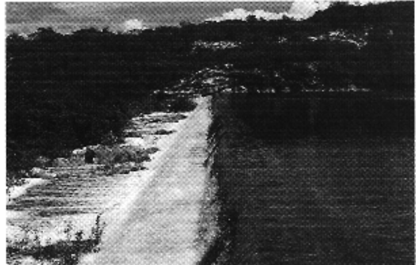
No dia 31 de março do ano passado, o estado contava com mais de 40 açudes vertendo

Na tarde deste domingo, 31, a ferramenta da Fundação já havia confirmado a ocorrência de chuvas em 119